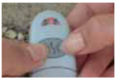
La lumière s'accélère. Relâcher.