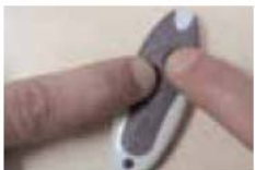
La lumière s'accélère. Relâcher.