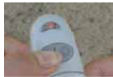
La lumière se fixe. Relâcher.