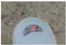
Relâcher L'émetteur est cloné.

4 - La lumière de la télécommande vierge clignote 3 fois.