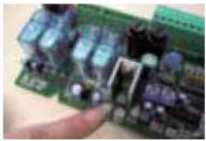
La lumière de la carte clignote