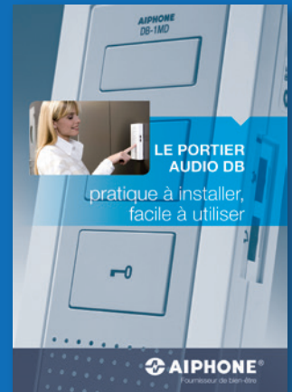
SÉRIE DB Le portier audio pratique à installer, facile à utiliser