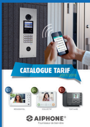
CATALOGUE GÉNÉRAL 2017/2018