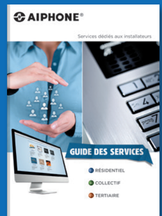
GUIDE DES SERVICES