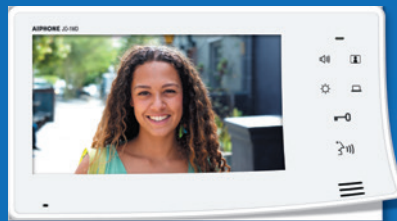
SÉRIE JO Portier vidéo couleur