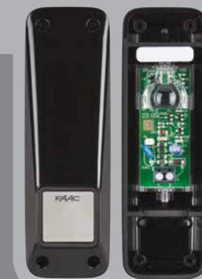
XP 20 D

Système avec alimentation filaire 24 V de l'émetteur et du récepteur.