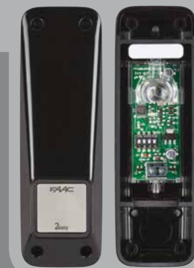
XP 20B D

Système avec alimentation filaire 24 V de l'émetteur et du récepteur.