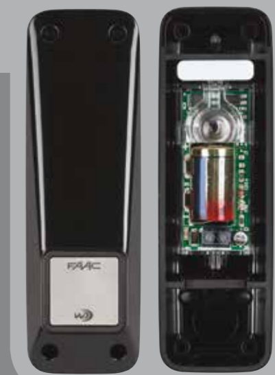
XP 20W D

XP 20B D est un système avec alimentation par BUS2easy. Ce dernier est composé de seulement 2 fils non polarisés (24V) avec la possibilité d'installer jusqu'à 16 paires de photocellules sur la même installation. Il permet aussi la protection contre les interférences produites par des sources lumineuses extérieures comme les phares LED des automobiles.