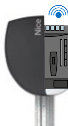
Logique de commande Nice