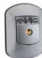
XK 21 L 24 V - Contacteur à clé anti-effraction avec déverrouillage à levier (uniquement avec carte 200 B.T. et 200 MPS)