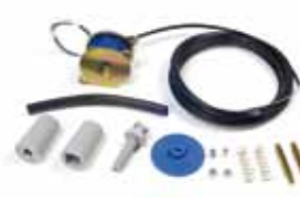
EF - 27 ** Système de verrouillage électromécanique avec déverrouillage manuel série 227