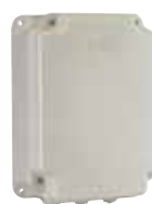
Boîtier mod. E pour cartes électronique 200 MPS (dim. h 265 x l 204 x p 85)