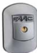
XK 21 H 230 V - Contacteur à clé anti-effraction avec déverrouillage à levier (uniquement pour R 180 - R 280)