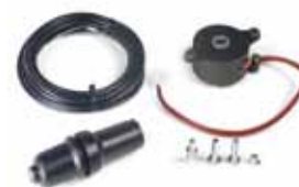
Système de verrouillage électromécanique avec déverrouillage manuel R 180 - R 280*