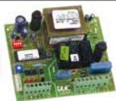
Carte électronique de commande 200 MPS Caract. techniques à la page 171