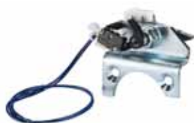
Dispositif anti-chute (conforme norme EN13241-1)