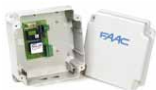
Appareil de commande à contact maintenu 200 B.T. Caract. techniques à la page 171