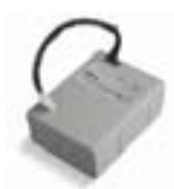
PS124 Batterie 24 V avec chargeur de batterie intégré. P.ces/emb. 1