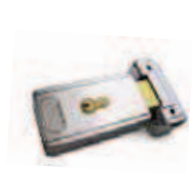
PLA11 Serrure électrique 12 V horizontale (obligatoire pour battant supérieurs à 3 m). P.ces/emb. 1