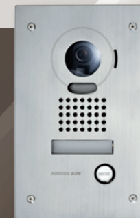
JODVF (302950) Platine encastrée