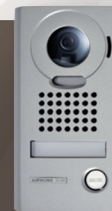
JODV (302949) Platine saillie