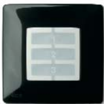
WS plaque murale carrée

Les plaques murales Opla de NiceWay sont disponibles dans les versions carrée Opla-S et rectangulaire Opla-R et dans de nombreux coloris.