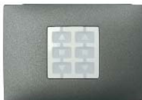
WR plaque murale rectangulaire