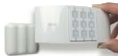
Le support mural avec fixation magnétique