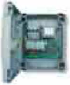
A500 Logique de rechange. Pces/emb. 1 € 511,00