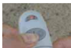
La lumière se fixe. Relâcher.