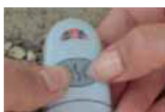
La lumière s'accélère. Relâcher.