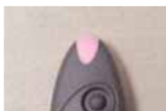
Relâcher L'émetteur est cloné.

4 - La lumière de la télécommande vierge clignote 3 fois.