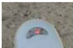
Relâcher L'émetteur est cloné.

4 - La lumière de la télécommande vierge clignote 3 fois.