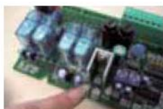
La lumière de la carte clignote