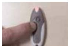
La lumière se fixe. Relâcher.