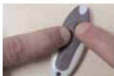
La lumière s'accélère. Relâcher.